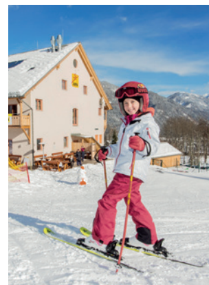
JUFA Hotel Montafon vor Bergpanorama